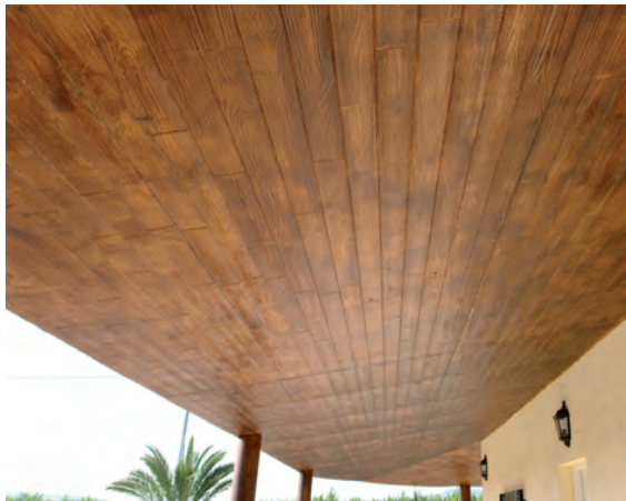
Acabado final en barniz. / EN.Final finish with varnish. / FR.Finition vernis. / DE.Betonbau mit Lackanstrich.