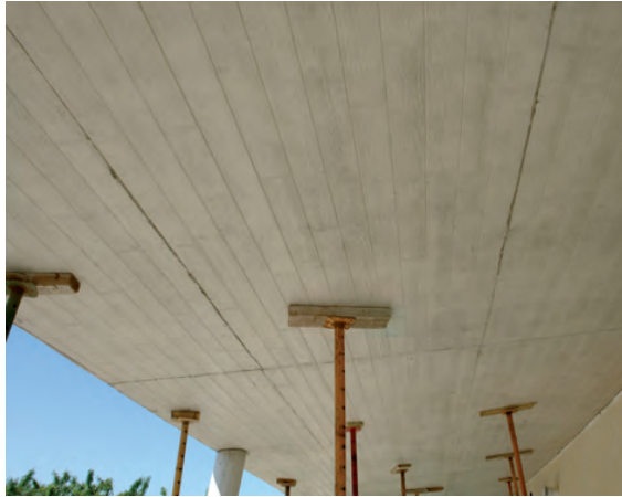
Acabado en hormigón. / EN.Concrete finish. / FR.Finition béton. / DE.Betonbau.