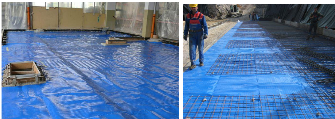
Izvedba lahko poteka na odprtem prostoru ali pa že v postavljenem objektu

GEFITAS PE 3/300 zapora pred vlago se vgradi na utrjen tamponski sloj ali podložni beton. Vsi vzdolžni spoji se lepijo z že vgrajenim lepilom. Prečni spoji se zalepijo z butilnim dvostranskim lepilom širine 20mm ali PAB detail membrane lepilnim trakom širine 10 cm.